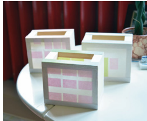
"Mino Lightboxes", 2014 Yana Poppe / Mino washi en hout

Wanneer ik aan het schilderen ben voelt het alsof ik aan het ontleden ben, of, juist aan het bouwen ben zoals een architect. Ik wil inzicht krijgen in verhoudingen, ruimte en misschien wel ontdekken waar precies de esthetiek zit. Met behulp van kleur probeer ik een overzicht te krijgen van de kenmerken van de architectuur. Wel ben ik me tijdens dit proces bewust van hoe bepaalde kleuren op elkaar reageren en beïnvloed ik ook het uiteindelijke beeld.