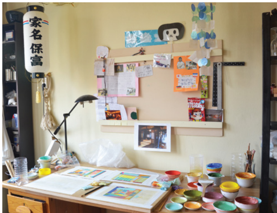
Een deel van het atelier van Yana Poppe